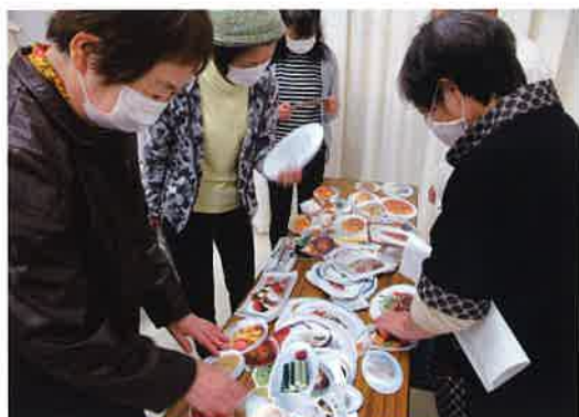
おかずカードを使い栄養の学習