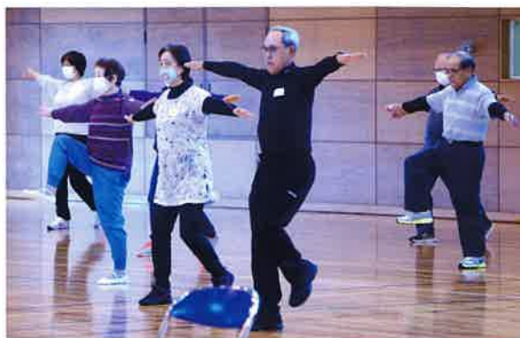
健康づくりのための運動時の様子

～健康寿命を延ばす具体的な習慣を運動、栄養面から学習し、 地域で活動できる“健康づくりのサポーター” 「健康長寿サポーター」を育成します～