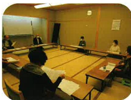
6月 シニアの詩吟体験講座