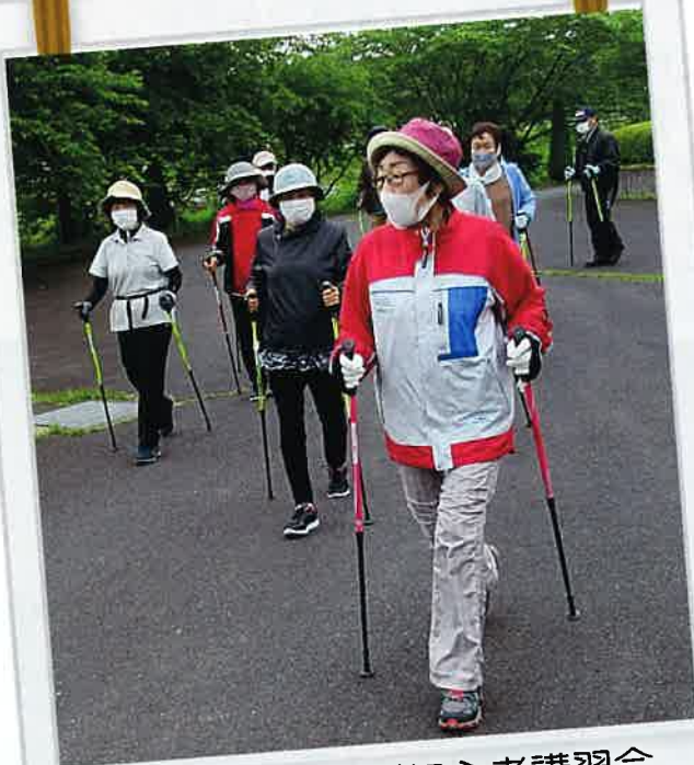
春のウォーキング初心者講習会 (巖美周辺 5/27)