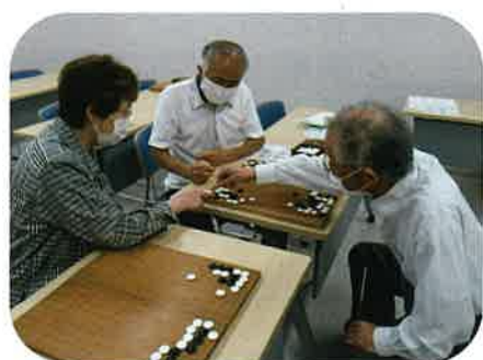
5月 シニアのための囲碁入門講座