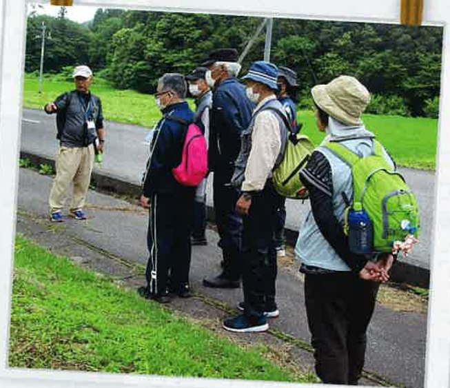
男の骨寺荘園ウォーキング (6/24)