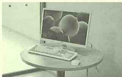
情報はネットで検索