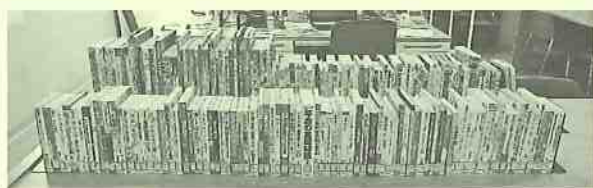
図書の閲覧コーナー