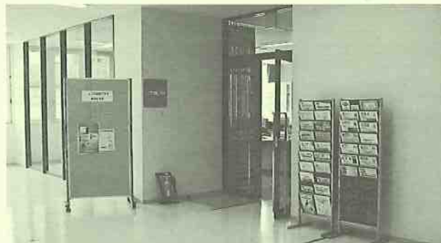
シニア活動プラザ