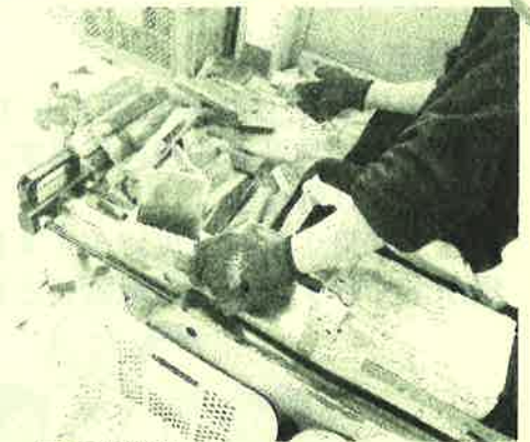
(薪割機械での作業の様子)