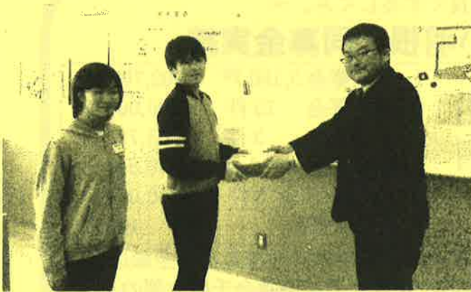
千厩小学校児童会 様