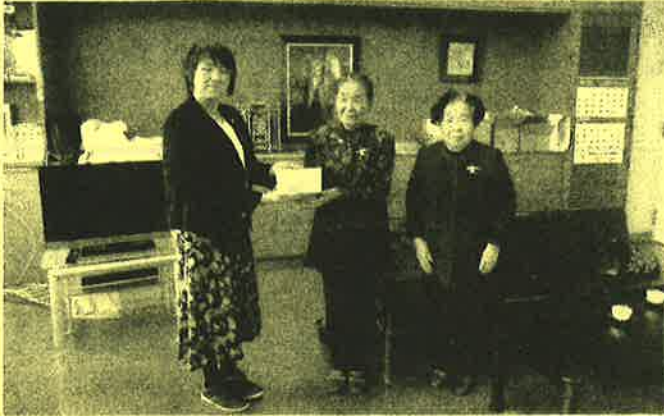
千厩地区婦人会 様