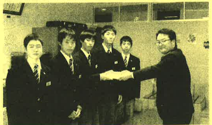
千厩中学校生徒会 様