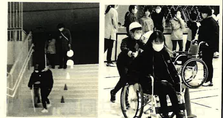
アイマスク・白杖で校舎内を歩きました 体育館での車いす体験

11月15日(水)、室根小学校4年生の親子行事でキャップハンディ体験を行いました。当日は50名で親子ペアを組み、車いすの体験とアイマスクをつけての白杖体験をしました。自分たちに今何ができるのか、相手の立場になって考えることを学びました。