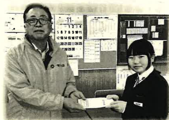
室根中学校保健委員会

昨年10月から12月末まで赤い羽根共同募金と歳末たすけあい募金が展開されました。活動に協力いただきました町内福祉委員の方々をはじめ、募金に協力いただきました地域の皆さま、誠にありがとうございました。