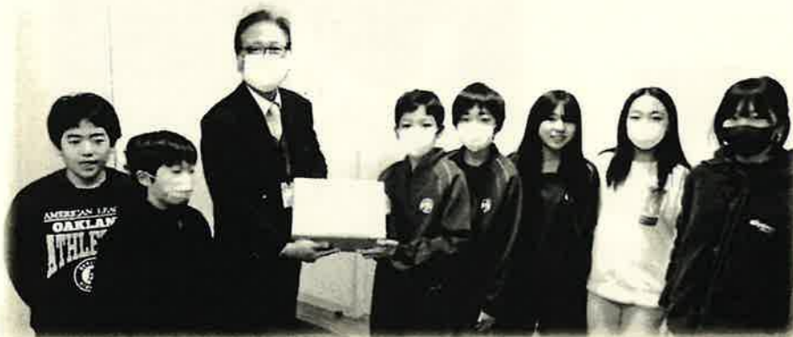
室根小学校児童会