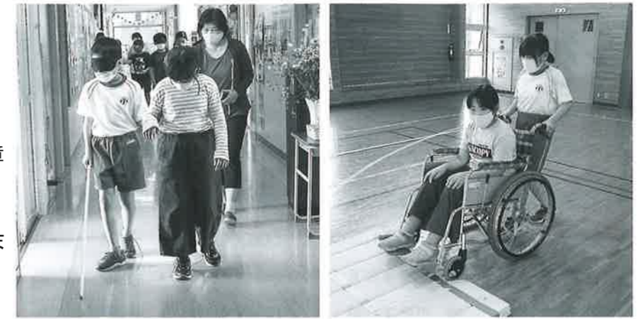
実際に校舎内を歩いて体験

当日は、15名の児童と車いす体験や白杖を使った視覚障がい体験を行い、自分たちに今何ができるのか、相手の立場になって考えることを学びました。