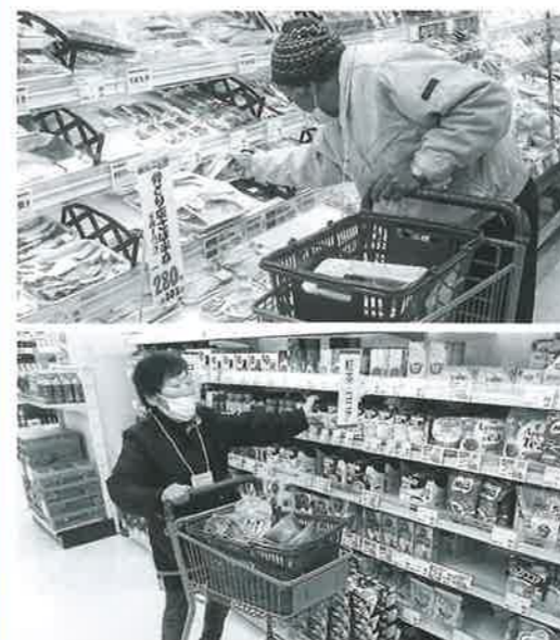
お目当ての商品を見つけました♪

室根地域の一人暮らし高齢者の方々、スタッフの総勢9名で買い物を楽しんできました。