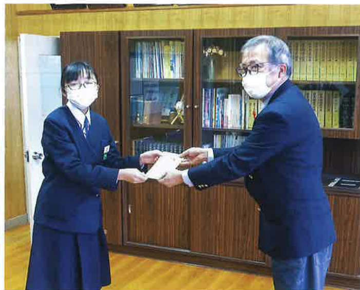
室根中学校保健委員会

昨年10月から12月末まで赤い羽根共同募金と歳末たすけあい募金が展開されました。活動協力いただきました町内福祉委員の方々をはじめ、募金協力いただきました地域の皆さま、誠にありがとうございました。