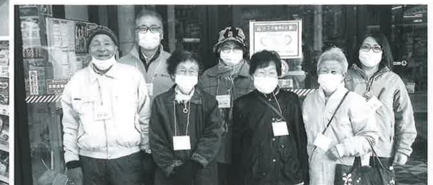
みんな笑顔で記念撮影☆