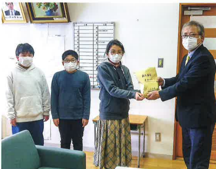
室根西小学校児童会