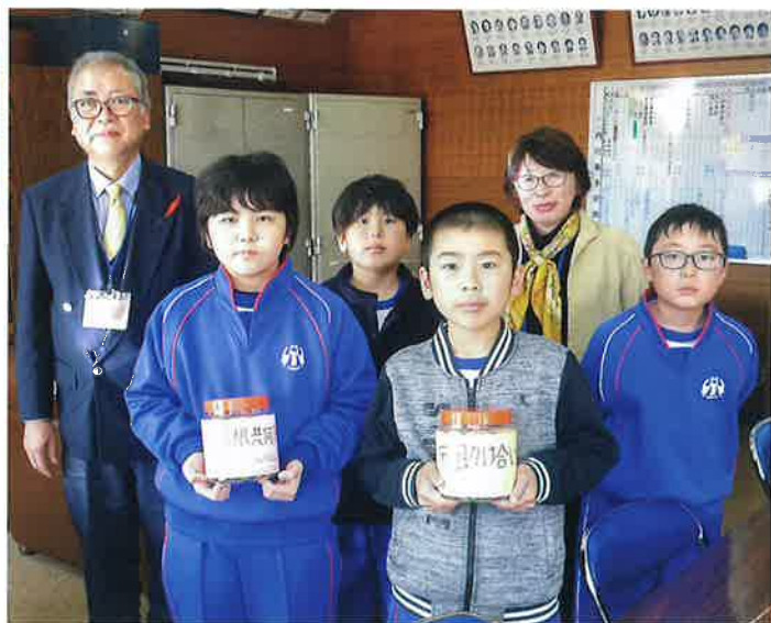
室根東小学校児童会