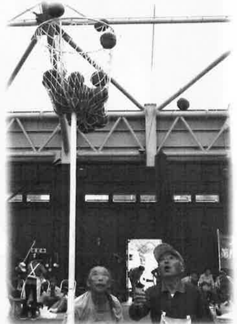
入ったかな 「玉入れ」