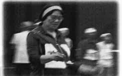
落ち着いてやさしくそつとそつと 「お玉はやさしく」