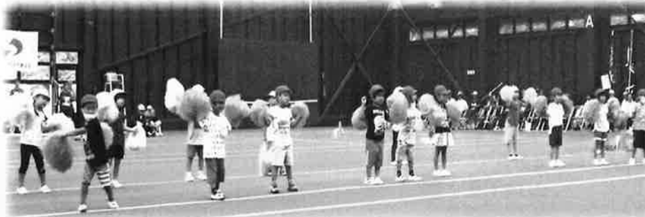
室根こども園ひまわり組の子供たちもお遊戯で応援です。