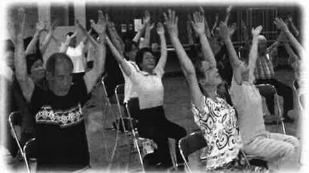
フレイル予防体操 実技の様子