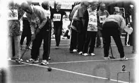
一発通過を狙うが・・・ 「ゲートボールリレー」