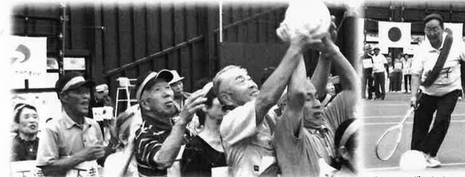
チームワークでガンバレ!! 「ボール送り」