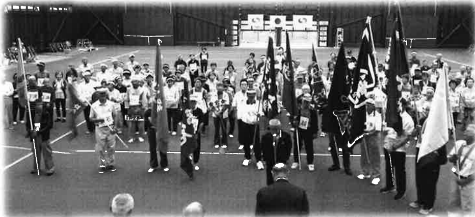
声高らかに選手宣誓・前年度優勝チーム「ひこばえクラブ」

9月7日(金)、室根きらめきパークを会場に 第49回室根地域シニアスポーツ大会が開催されました。 室根町内11老人クラブ会員300人が集まり、クラブ対抗で熱戦が繰り広げられました。