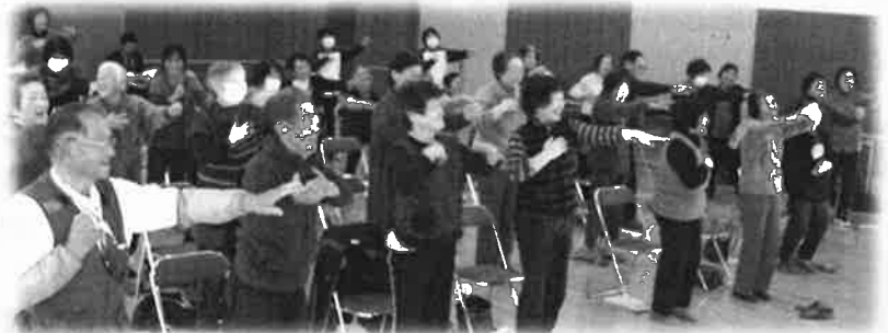
ふれあいサロン研修会・交流会は、年3回開催しました。