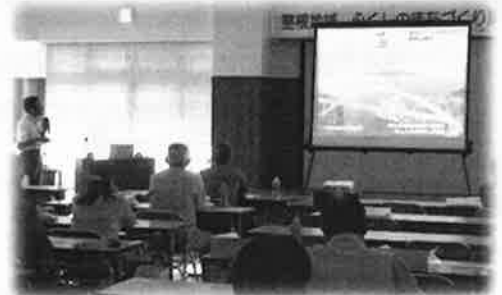
ふくしのまちづくり講演会 年2回 開催しました