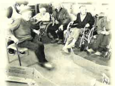
「祝 室根バイパス開通ゲーム」