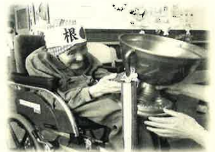
優勝杯贈呈 今年の優勝は白組

今年の競技は、足でつなぐ”みんなの輪”、玉入れ、「祝 室根バイパス」の3種目。紅白対抗で熱戦が繰り広げられました。各チームは、エンゼルトランペットや朝顔の種なども植え、どちらのチームの植物が先に花を咲かせるか予想し、来たる夏へ思いを馳せました。