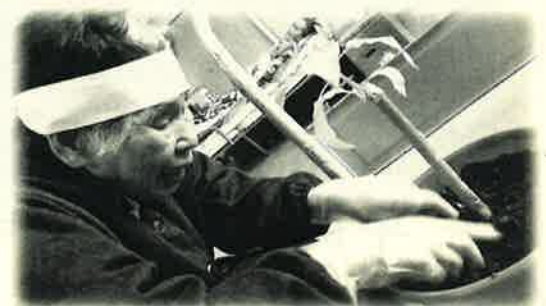
運動会を記念して植物も植えました。