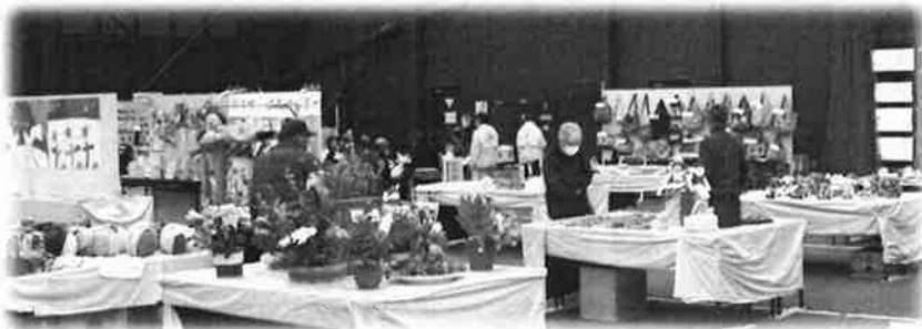
ふくしまつりでは、ふれあいサロン作品展等を開催、見事な作品が揃いました。