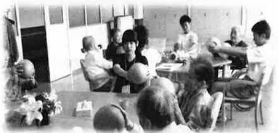
夏休みを利用した「チャレンジ福祉体験」 千高生・室中生、21名が参加しました。