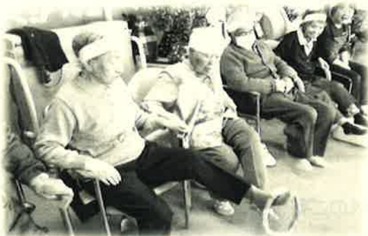
足でつなぐ”みんなの輪”