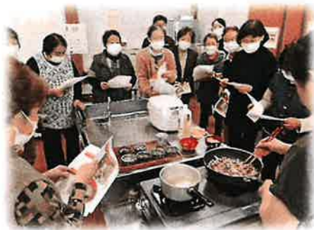
簡単に作れる中華レシピを伝授！