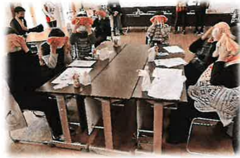
自宅でも簡単にできるアイスパを体験♪