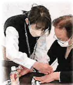
マニキュアなどのネイル体験をしていただきました☆

今年度は、サロン活動の一助になればと、(公財)岩手県生活衛生営業指導センターにご協力いただき、「岩手セイエイ百