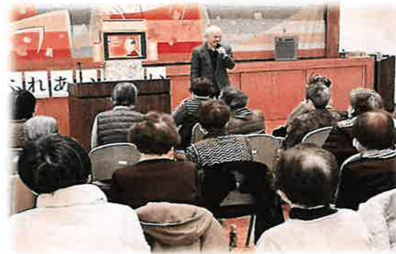
とても聞きやすい優しい声に、皆さん聞き入ってます

参加者からは、「前は会えなかった友達と会えた」「たくさん笑って話すことができ、よい気分転換になった」などの声をいただきました。