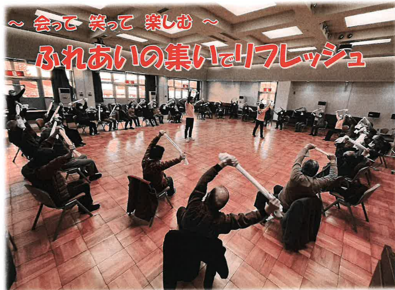
タオルやボールを使い、声を出して身体を動かしました

一関市社会福祉協議会川崎支部では3月8日、65歳以上のひとり暮らしの方や高齢者のみ世帯の方々を対象に「川崎地域ふれあいの集い」を開催しました。