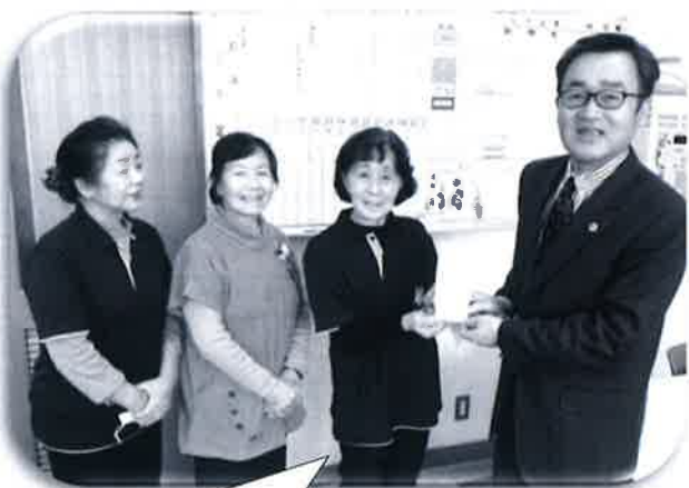
田河津婦人会から 赤い羽根（一般）募金へ