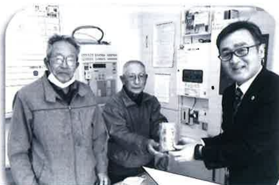
一関市グランドゴルフ協会東山支部から 歳末たすけあい募金へ