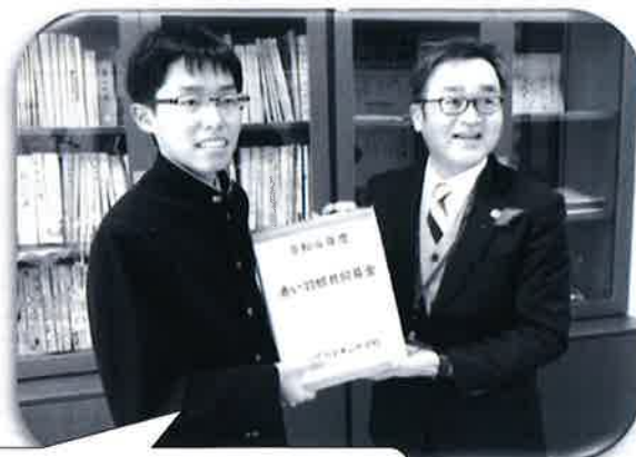
東山中学校生徒会から 赤い羽根（一般）募金へ