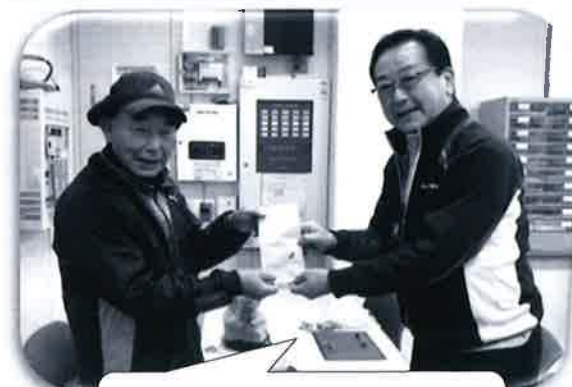
松川パークゴルフ同好会から 歳末たすけあい募金へ