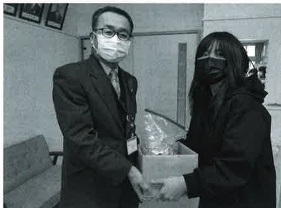
東山小学校での受領の様子