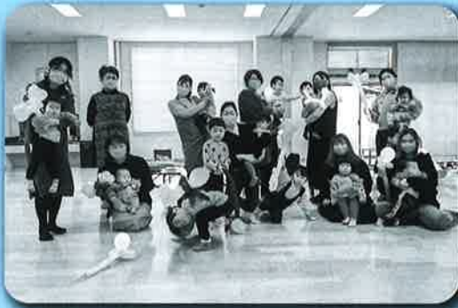
☆作品を持つての集合写真☆

令和4年1月14日(金)東山保健センターで、一関にあるバルーンキッズさんを講師にお招きし、バルーンアートを楽しみました。犬とにこちゃんマークのスティッキとちょうちょを作りました。風船を膨らませるところから自分たちの手で行ない、少し難しいところもありましたが、かわいい作品を作れて子どもたちも喜んでいました。