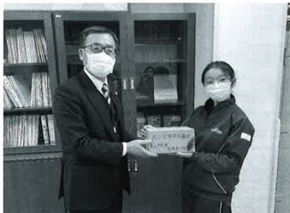
東山中学校での受領の様子

東山中学校生徒会の皆様、東山小学校児童会の皆様、 校内募金のご協力大変ありがとうございました。