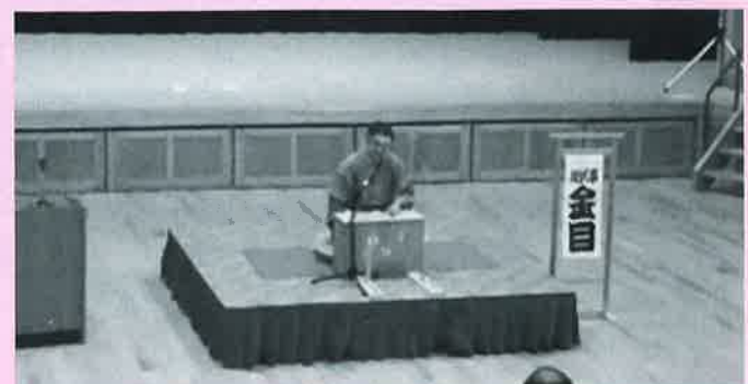
地伏亭金目氏による講談の様子