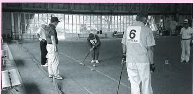
各チーム真剣勝負です

第40回東山地域老人クラブゲートボール大会が、令和2年7月29日すばーく藤沢で開催されました。