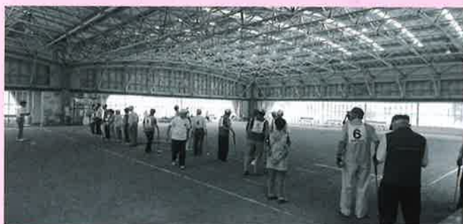
いよいよ競技が始まります