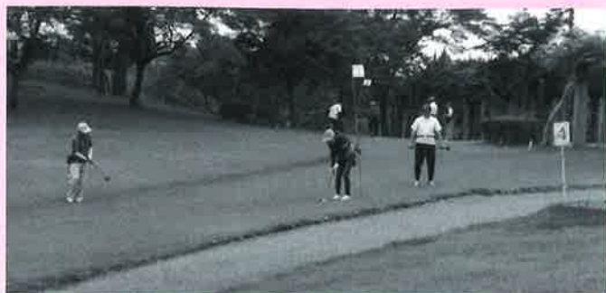
一打一打狙いを定めて