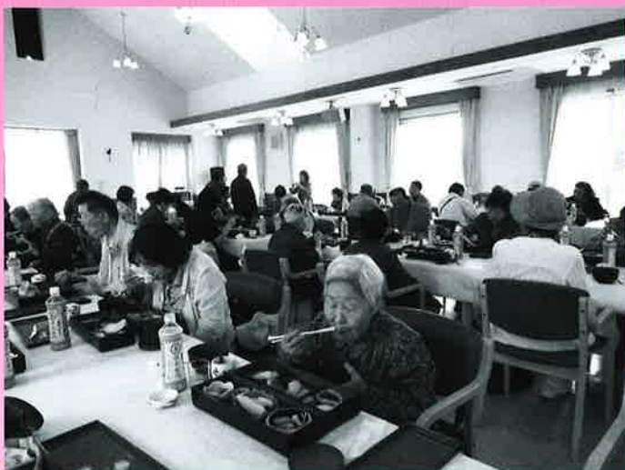
地元の食材を使用した「はずみ御膳」をいただきました