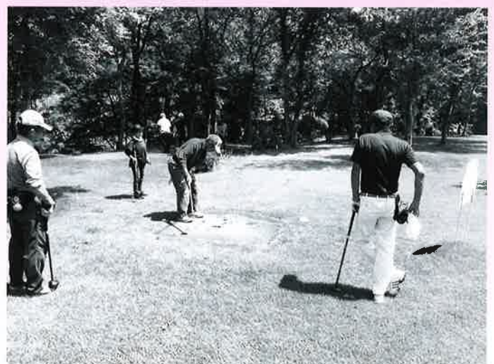
～ 天気にめぐまれ好プレー ～