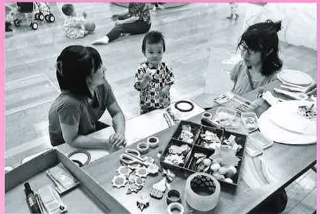
手形をペタッと大喜びでした