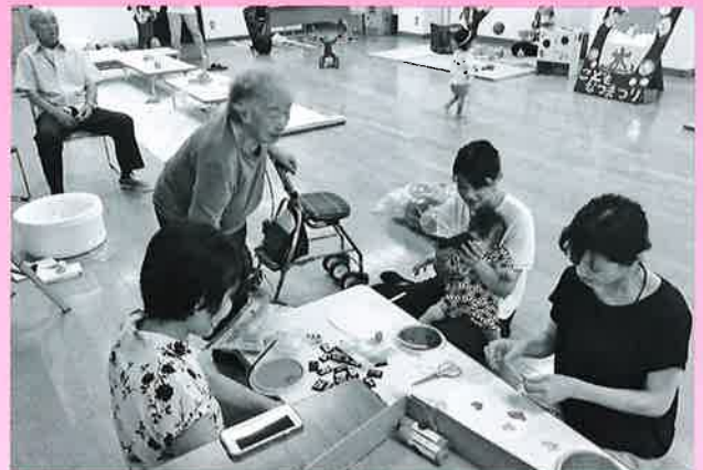
作っている様子が気になります