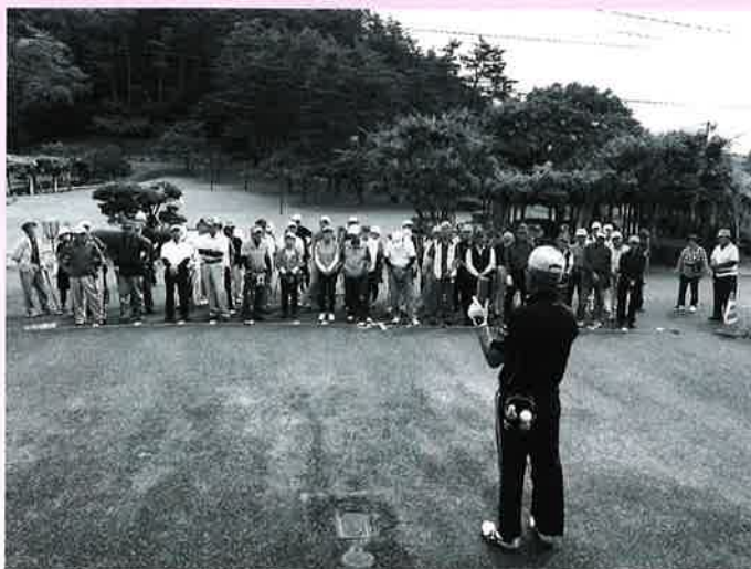
～ 開会式の様子 ～