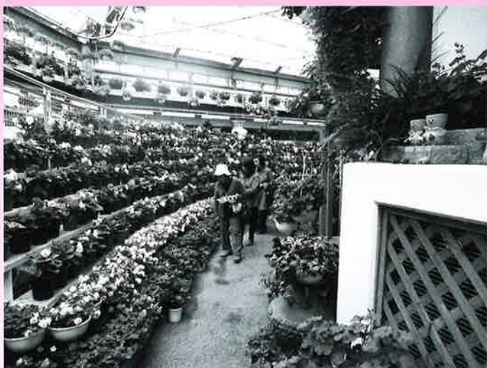
館内にはたくさんのペゴニアが咲いていました