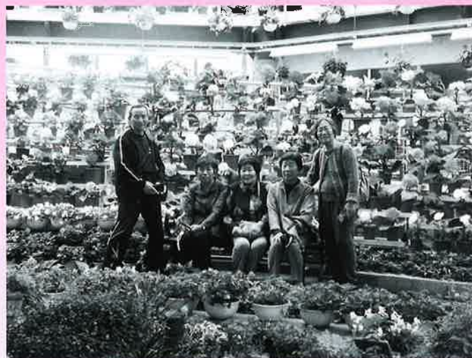
たくさんのペゴニアに囲まれての撮影