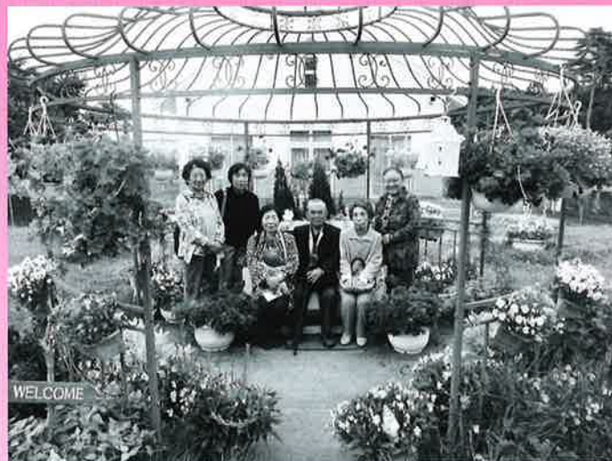
花の庭園で記念撮影