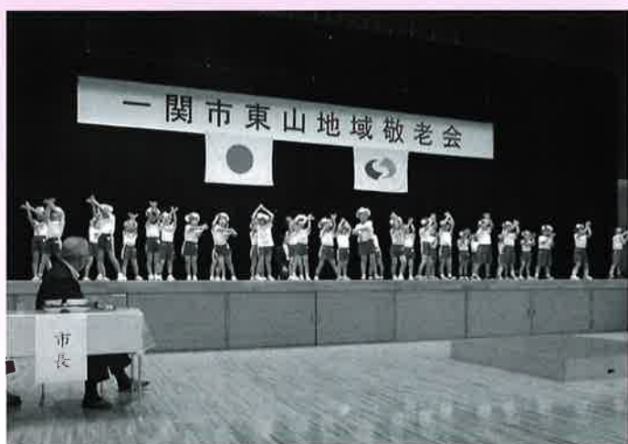
東山地域の年長児による発表の様子