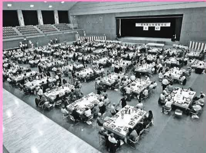
会場の東山総合体育館にはたくさんの当祝者があつまりました