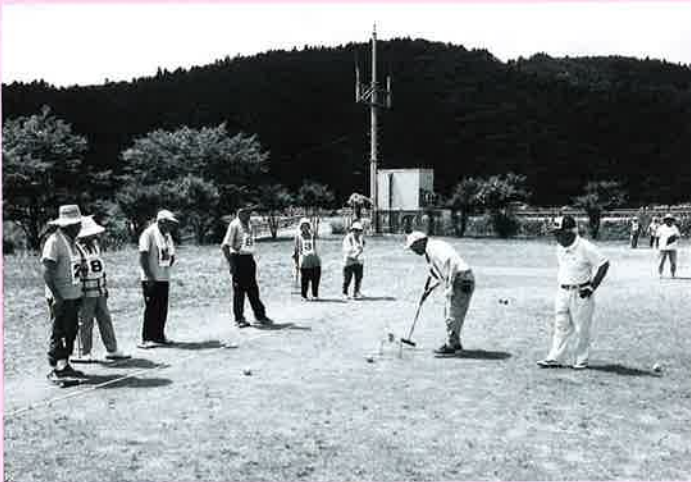
暑い中にもかかわらずナイスプレーが続出

第39回東山地域老人クラブゲートボール大会が、令和元年8月1日松川西前ゲートボールコートで開催されました。今回のゲートボール大会は、真夏の暑い中6チーム22人が参加し熱戦が繰り広げられました。大会結果は、優勝が天寿会チーム、準優勝は寿久栄会チーム、第3位は長友会チームでした。