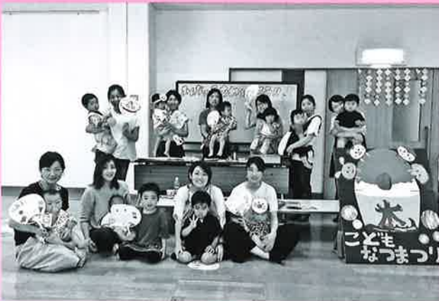
参加者全員で記念撮影☆