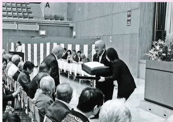
米寿者へ勝部市長より記念品贈呈