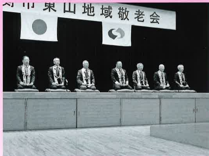
祝謡「四海波きんぴか会」