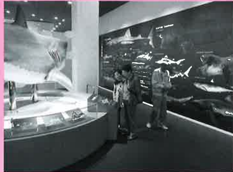
～日本で唯一のサメの博物館を見学～