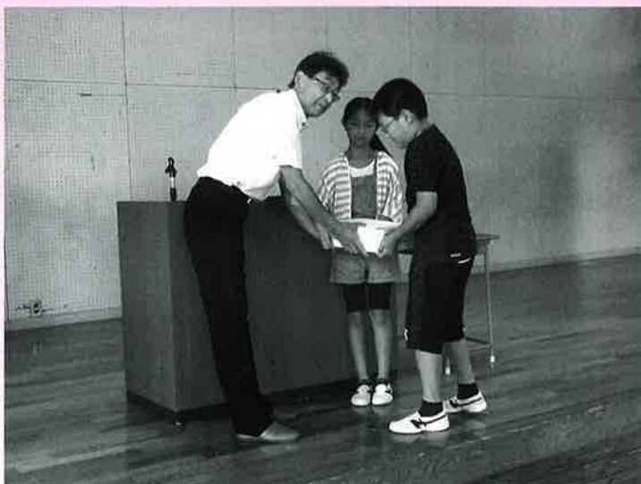
～平成30年7月豪雨災害義援金の贈呈式(7月24日)～

東山小学校児童会は、7月24日に「平成30年7月豪雨災害義援金」として48,015円、9月20日には「平成30年北海道胆振東部地震災害義援金」として55,773円を、共同募金委員会東山地区事務所に寄付していただきました。