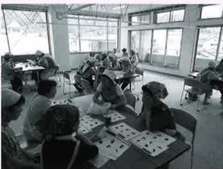
～空き時間はクイズで楽しみました～