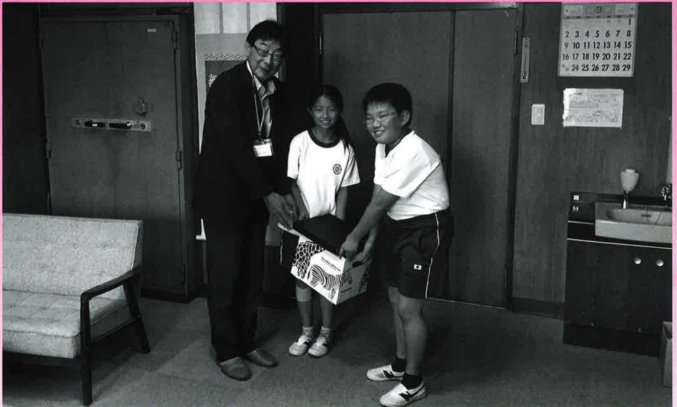
～平成30年北海道胆振東部地震災害義援金の贈呈式(9月20日)～