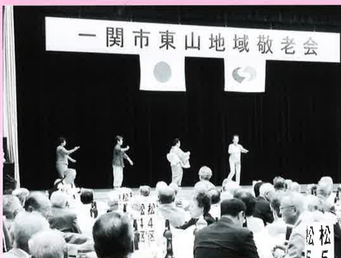
～長坂2区の方々による「長坂音頭」「げいび小唄」～