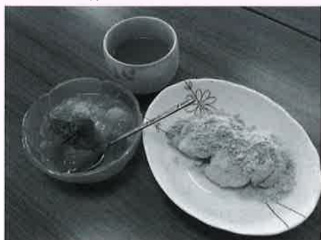
～完成したゼリーとくず餅～