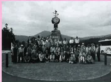
～道の駅むろねでは記念撮影をしました～