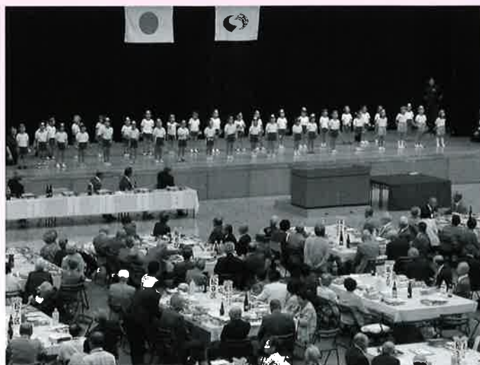
～東山地域の年長児によるアトラクション～