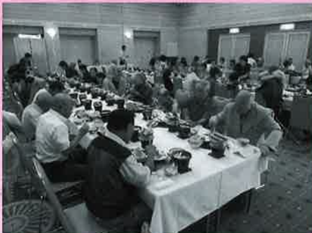
～気仙沼プラザホテルでは海の幸を堪能しました～