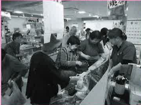
～海の市での買い物の様子～

第1回ひとり暮らし高齢者の集いが、6月8日（金）気仙沼プラザホテルを会場に、55人が参加して開催されました。今回の集いでは、シャークミュージアムを見学したり、海の市で買い物を楽しみました。気仙沼からの帰りには、室根町に4月オープンした「道の駅むろね」に立ち寄り、ショッピングを満喫しました。今回は、買い物する場所が多かったので、参加者の皆様はたくさんの買い物袋を持ってお帰りになりました。