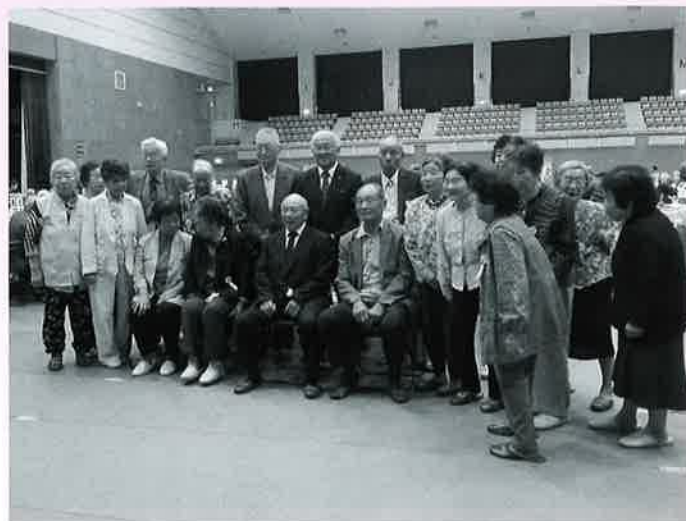
～勝部市長との記念撮影は皆さんの楽しみ☆～