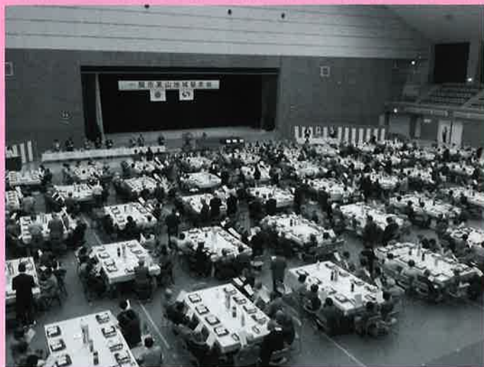
～大勢の方々が出席した東山会場の様子～