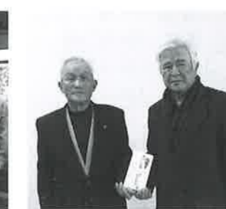
一関市グラウンドゴルフ協会花泉支部様