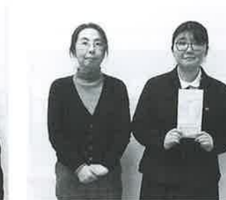
花泉高等学校図書委員会様