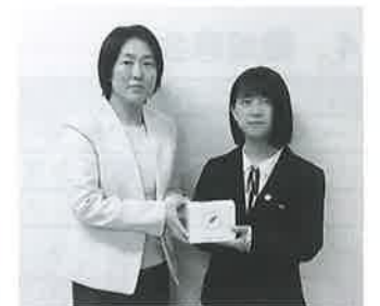
花泉高等学校インターアクト委員会様