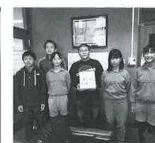
油島小学校児童会様