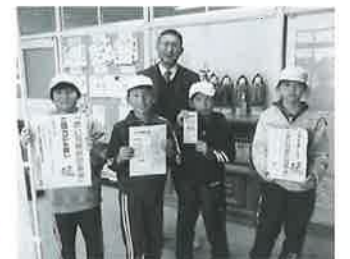
永井小学校児童会様