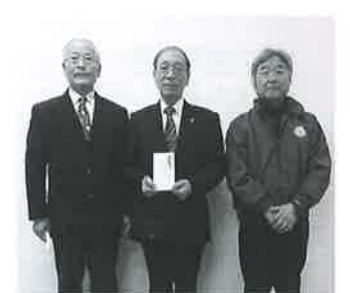
花泉ライオンズクラブ様