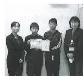
涌津小学校児童会様