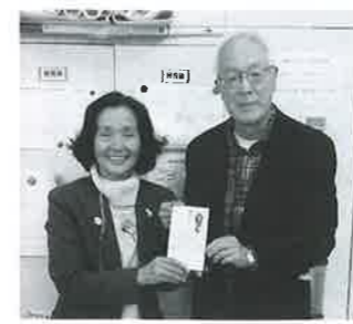
花泉ロータリークラブ様