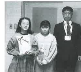
金沢小学校児童会様