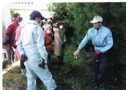
前回の講座の様子(会場:永井市民センター)

また、新型コロナウイルス感染症拡大防止を考慮し、参加者数を制限しています。開催を中止することもありますので、あらかじめご了承ください。