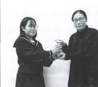
花泉中学校福祉委員会様