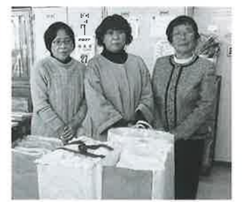
創価学会花泉支部様