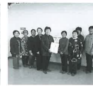
花泉地域婦人団体協議会様