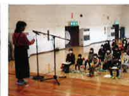
昔話・紙芝居読み聞かせ