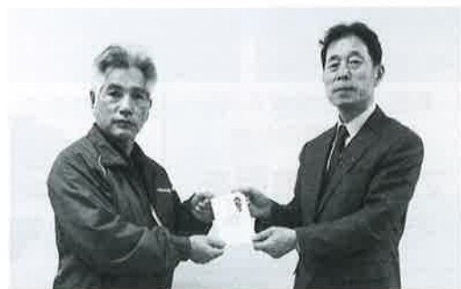
（有）カーウイングワールド様