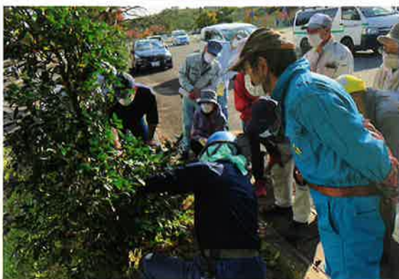
昨年度の講座の様子 (会場：花泉宿泊交流研修施設 花夢パル)