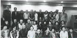
永井地区 湯けむり交流会