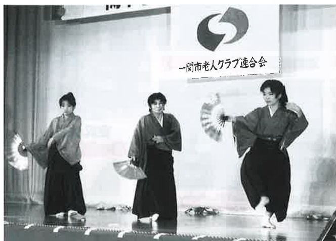
油島地区上油田クラブ『これから音頭』

また、入場料の一部と会場内で募ったチャリティー募金の44,787円は、一関市社会福祉協議会花泉支部に寄付をいただきました。