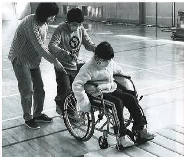
マットを使用した車いす体験の様子