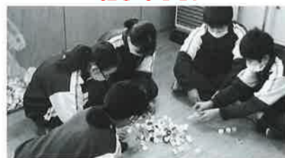
エコキャップの選別作業