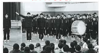
油島小学校との交流(応援団によるエール)