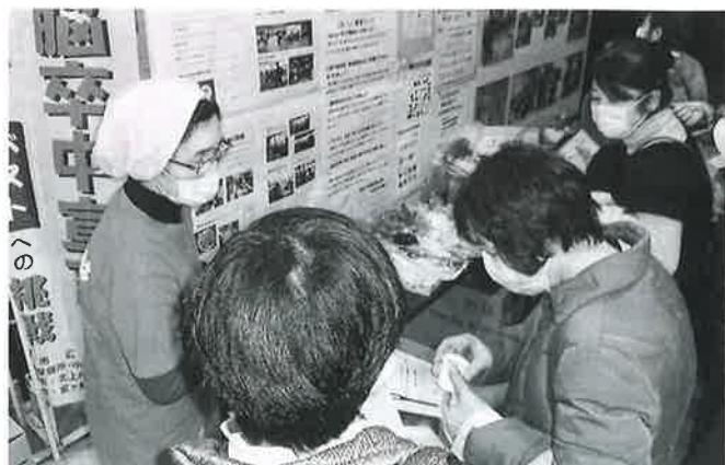
各団体の展示ブースは大盛況でした