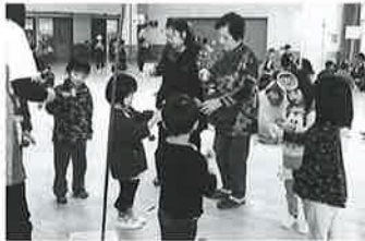
涌津地区 ふれあいサロン