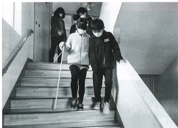
階段での杖体験の様子

3月3日(火)、涌津小学校4年生20名がキャップハンディ体験を行いました。白杖を使った視覚障がい体験や車いすの操作などを行いました。『相手の立場になって考えることが大切だと思った』や『自分から優しく声をかけたい』などの感想が寄せられ、体験をとおして相手を思いやり自分たちに何ができるかを考える機会となりました。