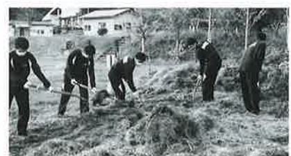
油島小学校との交流(除草作業の手伝い)