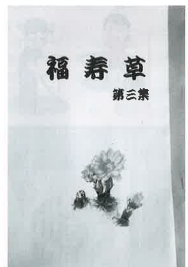
利用者のたくさんの思いが つまった文集『福寿草』