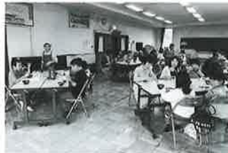
日形地区 子どもまつり