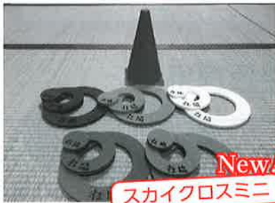
New! スカイクロスミニ

その他にもスカットボール、スカットボールⅡ、ポケットボール、ストライクボード、輪投げ、フラフープ、室内用グラウンドゴルフがあります。利用申込みは、一関市社会福祉協議会花泉支部までお問い合わせください。