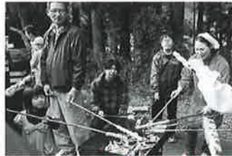
油島地区 油島っこまつり