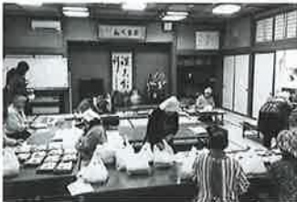
花泉地区 ふれあい給食