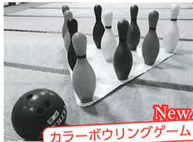
New! カラーボウリングゲーム