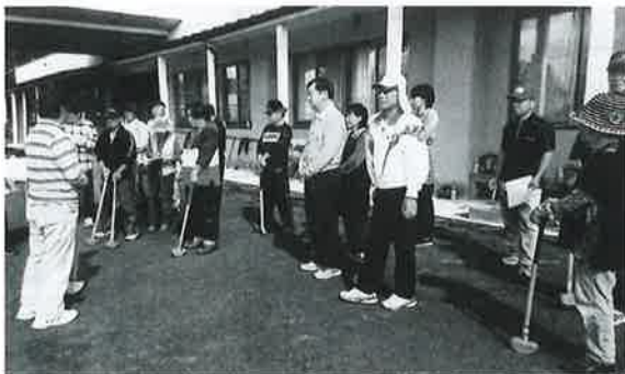
みんなでルールの確認です

白崖自治会では、世代間交流としてグラウンドゴルフ大会を行いました。白崖集落の住民を対象に、スポーツで世代間交流を図るために永井市民センターを会場に開催しました。今回グラウンドゴルフに初めて取り組む人もいて、皆さん親睦を深められたようです。