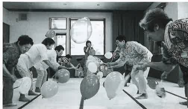
老松介護予防センターでは様々な活動を行っています

この文集は、老松介護予防センター利用者約200名の日々の出来事や自身の体験を、思い思いにつづった作品となっています。文集は利用者や関係団体に配布しています。