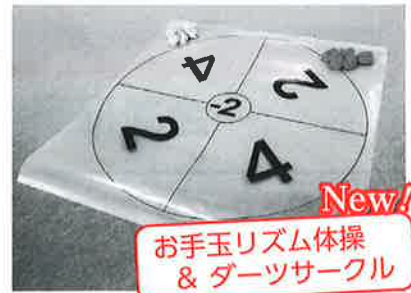
New! お手玉リズム体操 & ダーツサークル