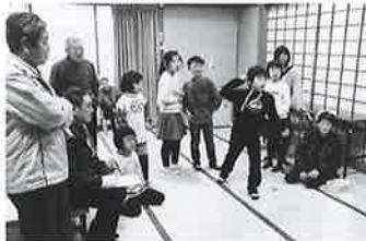
老松地区 いきいきサロン