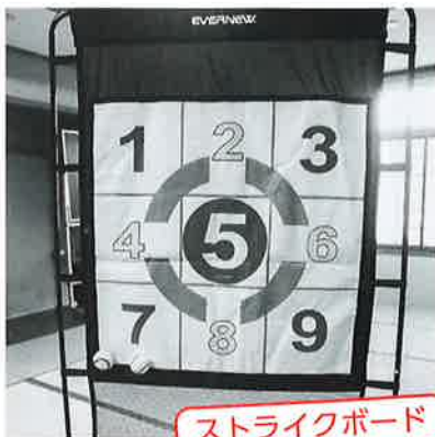
ストライクボード