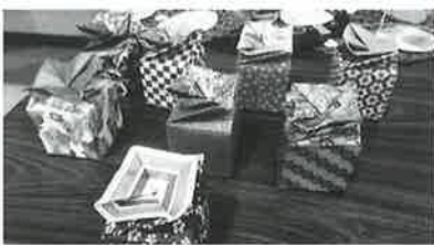
永井地区 狼ノ沢サロン