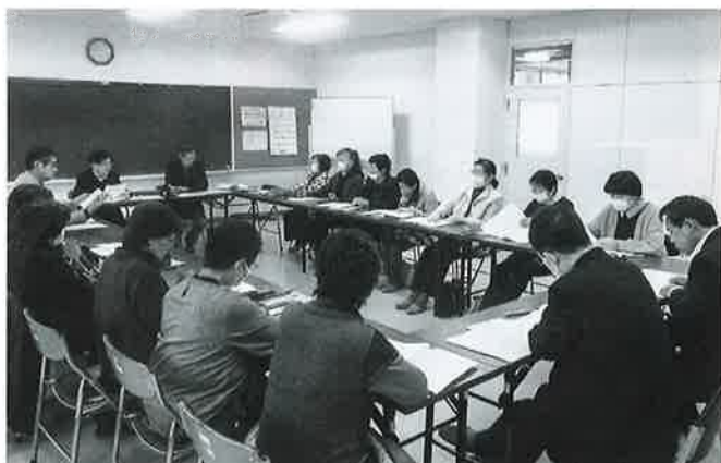
各部会研修の様子(障がい者福祉部会)