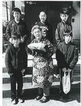
金沢地区 あったか弁当