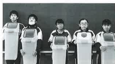
エコキャップの回収