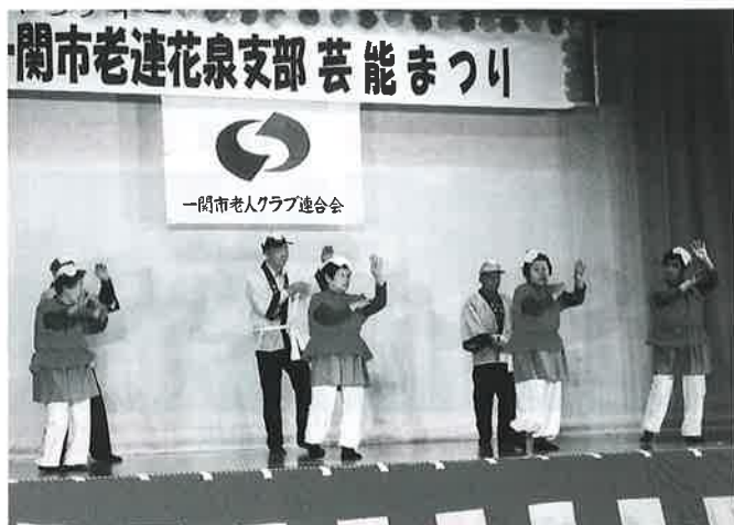
永井地区六道クラブ『パプリカ』