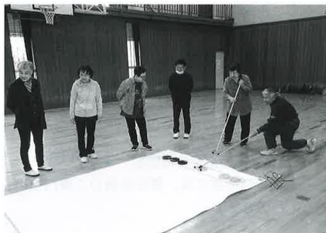
高得点を狙います！