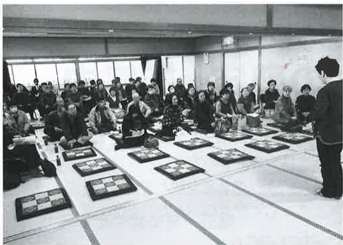
みんなで楽しく情報交換

当日は、サロンの代表者や世話人60名が参加し、ふれあいサロンについてレクリエーション指導などの内容で行われました。