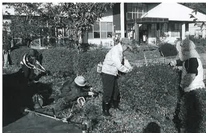
昨年第2回目の様子(油島市民センター)

この広報は、皆さまからいただきました共同募金の配分金の助成を受けて発行しております。