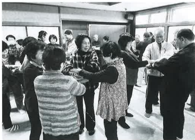
笑顔が絶えない研修となりました！