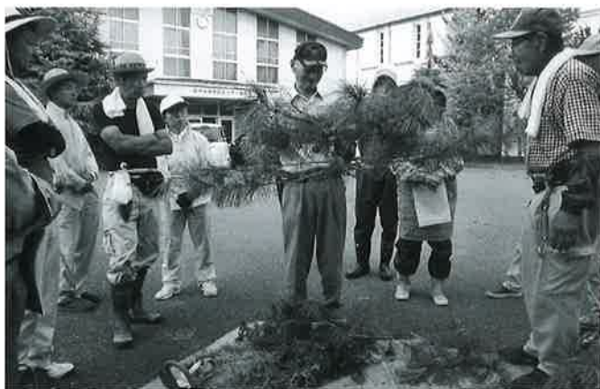
昨年第1回目の様子(永井市民センター)