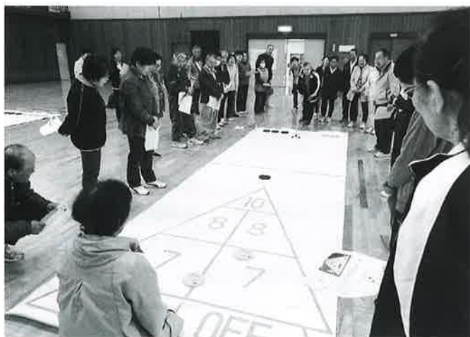
開会前にみんなでルールを確認

当日はシャッフルボードを行い、民生児童委員、主任児童委員合わせて39名が参加し、交流を深めました。