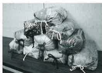
寄贈された色とりどりの手づくり健康枕