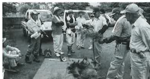
樹種ごとの剪定方法

講座では、教材用の樹木を使いながら木々の性質や剪定のポイントを学習し、実際に会場内の庭木を剪定し皆さんが腕を磨きました。綺麗に仕上がった姿に、皆さん大変満足できたようでした。