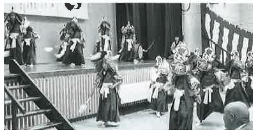
花泉地区敬老会 花泉地区鶏舞伝承保存会による鶏舞の披露