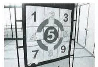
ストライクボード