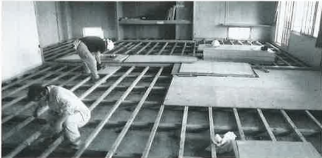
和室床の改修工事の様子