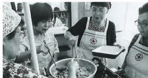
皆さん慣れた手つきで炊出し