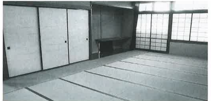
改修工事が完了し、綺麗になりました