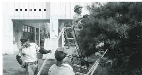
赤松の剪定作業の様子