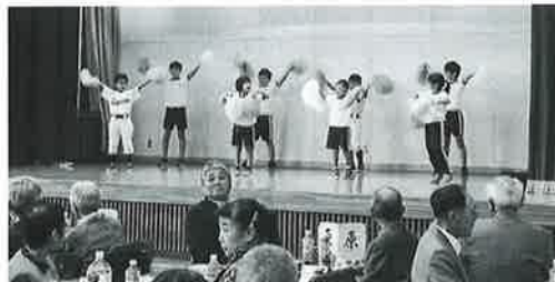
涌津地区敬老会 涌津小学校児童によるアトラクション