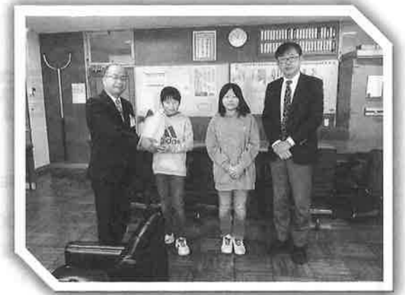
～ 藤沢小学校児童会 ～