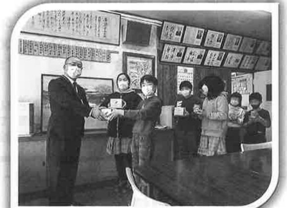
～ 黄海小学校児童会 ～