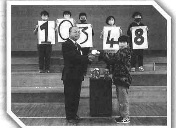
～ 新沼小学校児童会 ～