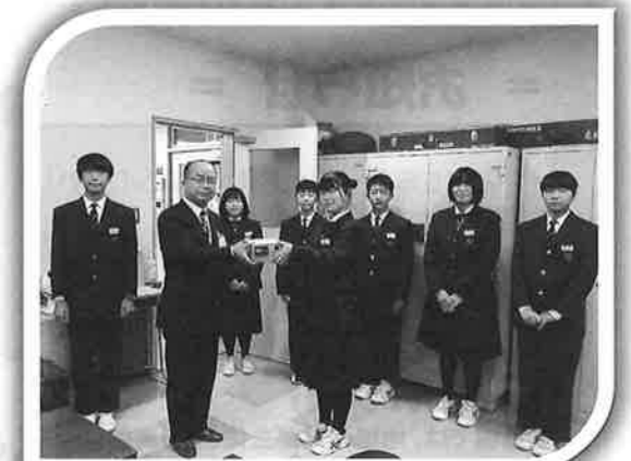
～ 藤沢中学校生徒会 ～