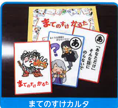
まてのすけカルタ