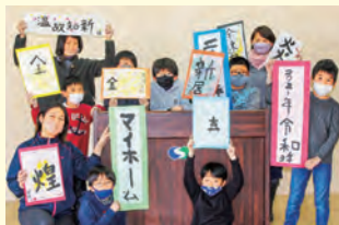
地域の支え合い活動応援事業