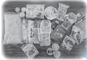
配布した食料セットの例

食料を受け取った方からは、「育ち盛りなので助かります。ありがとうございます」などのメッセージをいただいております。