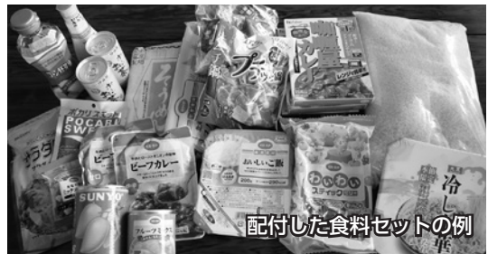
配付した食料セットの例

今回も地域の皆さまや市内の企業、団体の皆さまからたくさんのご寄附をいただき、ひとり親世帯68世帯へ食料をお渡しすることができました。