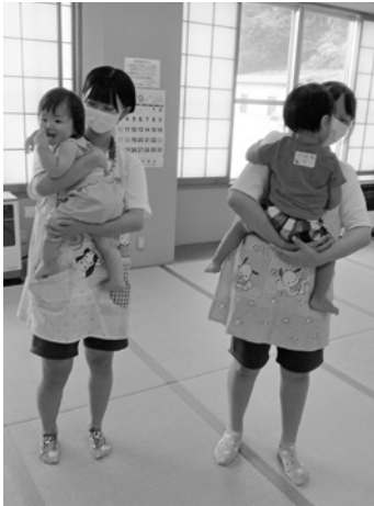
抱っこ体験もしました!