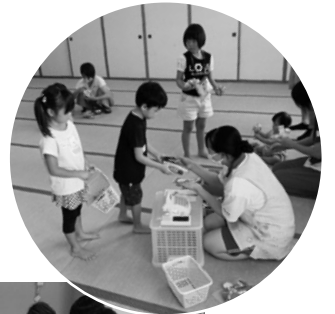
お買い物ごっこの様子

参加した高校生からは「子どもたちと楽しくふれあうことができとても勉強になった」「親の方々も交流でき、いいことだと思った」と感想をいただきました。