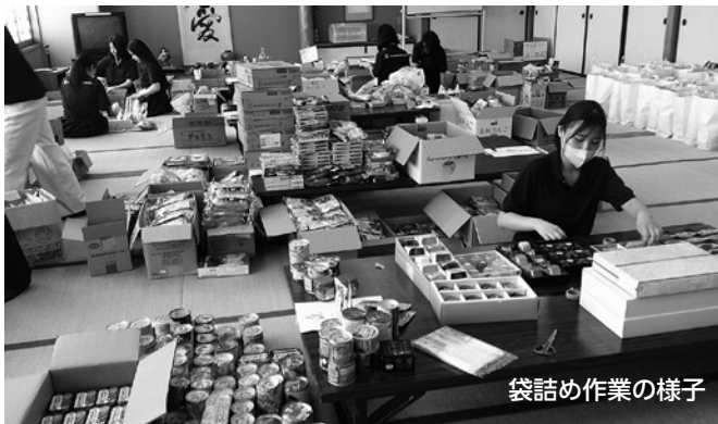
袋詰め作業の様子

物価高騰の影響で生活の負担が大きくなっているなかで、少しでも安心した食生活を過ごしていただけるよう、ひとり親世帯を対象に食料を配付しました。